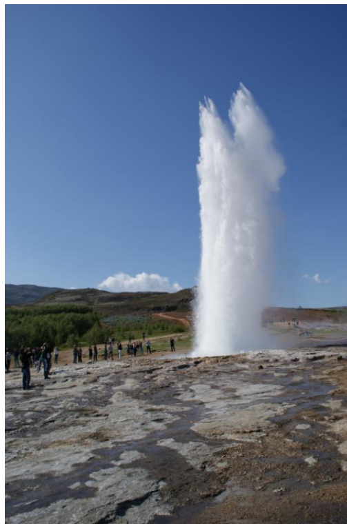
Telekat blev præsenteret på Island i juni 2010

Den 17. maj 2011 bliver der afholdt afsluttende konference i Telekat projektet på Aalborg Universitet. Præsentationer fra oplæg på dagen bliver lagt ind på www.telekat.dk og kan downloades herfra. Telekat projektet slutter 30. juni 2011.